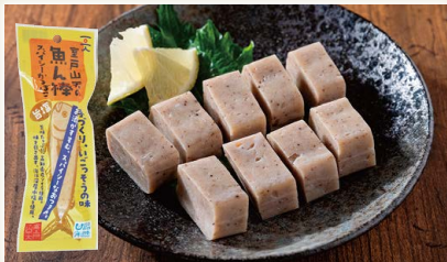
室戸山天の魚ん棒【旨塩】 [(有)山本かまぼこ店]

玉子豆腐と専用の野菜具沢山のジュレがセットになった商品です。食べ方は簡単!豆腐を器に移して上からジュレをかけるだけでおかずの一品になる商品。特に日々忙しいOLや主婦層をターゲットとしています。