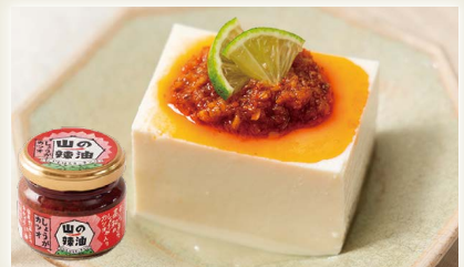
山の辣油しょうがカツオ [(株)いしはらキッチン]