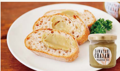
SAWATARI CHAJAM ほうじ茶 [(株)ピバ沢渡]