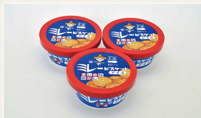
ミレービスケットアイス [(有)高知アイス]