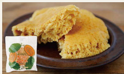
すえひろおばちゃんのはいからケーキ (万次郎かぼちゃ) [(株)末広]