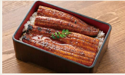
四万十うなぎ蒲焼

高知のソウルフードである鰹をたっぷり使い、室戸海洋深層水で仕込みました。土佐の味を一つのコロッケにギュッと閉じ込めた一品です。