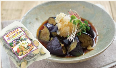
高知産冷凍揚げナス