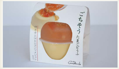
ごちそうたまご豆腐 (四万十トマトのコンソメジュレ) [(株)ぶらうん]

原料には、高知県東部に位置する室戸の良質な天然天草のみを使用し、土佐の鰹だしと生姜でさっぱりと食べるところてんです。この高知の夏の風物詩とも言える商品を、贈り物やお土産としてお買い求めいただけるように、爽やかに高級感のある箱に入れギフトにしました。(3個入)