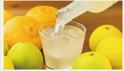
早摘み小夏と柚子Liqueur [土佐鶴酒造(株)]