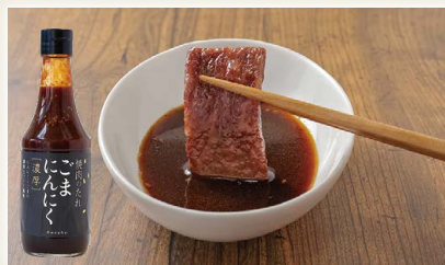
ケンシヨー焼肉のたれ (ごま・にんにく風味)