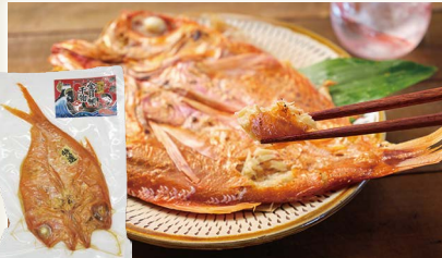
金目鯛の干物(常温保存品) [(株)East水産]