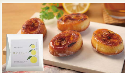
高知の焼き菓子 柚子ブリュレ [Maison de Sweets Hattori]