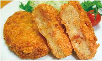
室戸海洋深層水仕込み 鰹たっぷりコロッケ