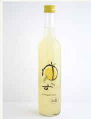
無手無冠ゆず [(株)無手無冠]