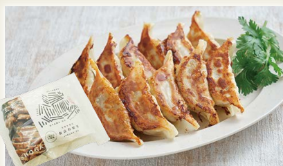
土佐を包むお山の餃子 (四万十ポークとれいほく生姜) [穀]