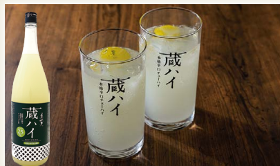
美丈夫蔵ハイ高知ゆず& 山椒本格辛口チューハイの素 [(有)濱川商店]