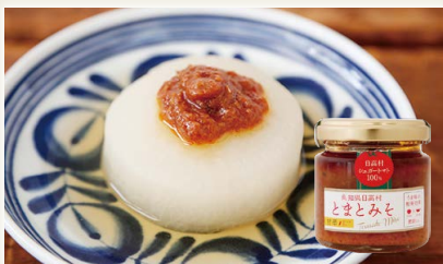
高知県日高村とまとみそ甘辛 [NPO法人日高わのわ会]