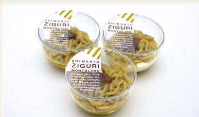
しまんと地栗モンブラン

室戸西山台地で育てられている絶品の金時芋「西山金時」をたっぷり使用。添加物不使用で、まるでお芋をそのまま巻き上げたような、どこにもない、全く新しいロールケーキです。