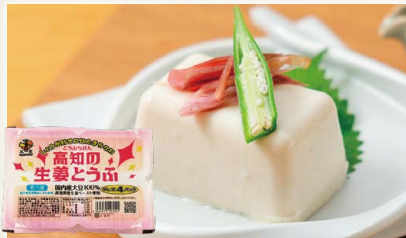
高知の生姜とうふ [(有)高橋豆腐]

地元漁港で水揚げされたシイラを100%使用し、味を引き出すため室戸海洋深層水塩を使用したこだわりのスパイシー蒲鉾。保存料、甘味料、着色料不使用です。この商品の原材料は、7大アレルギーにも対応して長期保存が可能です。