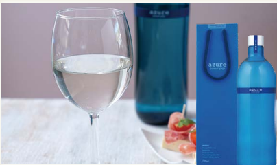
純米吟醸酒azure [土佐鶴酒造(株)]