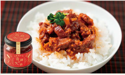
土佐あかうし奇跡のラー油 [(有)藤川工務店]