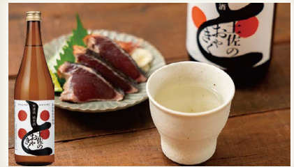
無濾過純米酒土佐のおきゃく [土佐鶴酒造(株)]