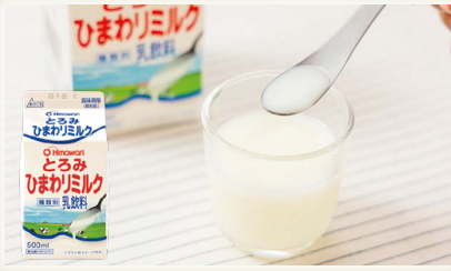
とろみひまわりミルク [ひまわり乳業(株)]