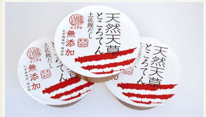
土佐の鰹だしところてん米酢 (無添加) [横山麺業(株)]

国産大豆と高知県産生姜でつくった美味しい豆腐です。室戸海洋深層水にがりを使用し、高知県産生姜の豊かな風味が香る、大豆の味の濃いなめらかな豆腐に仕立てました。