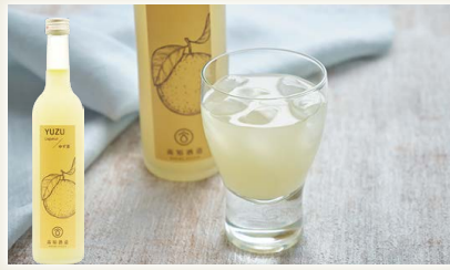
実生のゆず酒 [高知酒造(株)]