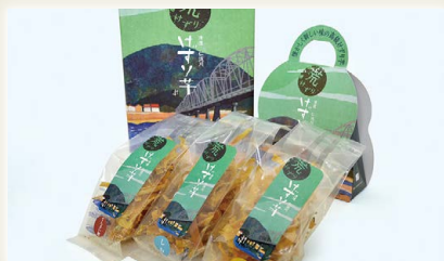
けずり芋荒けずり