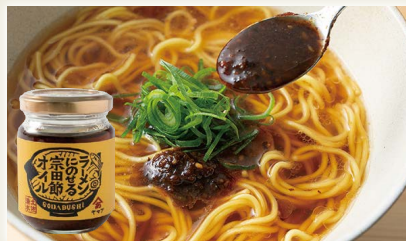
ラーメンにのせる宗田節オイル [(有)ヤマア]