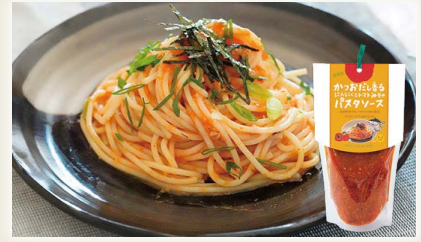
かつおだし香るにんにくと トマトみそのパスタソース [NPO法人日高わのわ会]