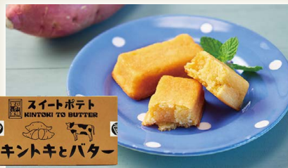
キントキとバター(プレーンBOX 5個入) [スカイアンドシー・ムロト]