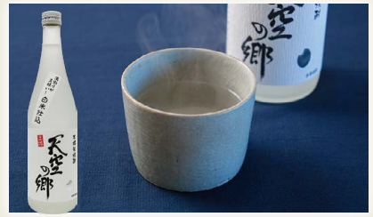
湯割りが美味しい! 天空の郷 [baum 高知本山蒸溜所]