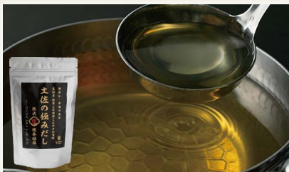
土佐の極みだし [森田鯉節(株)]