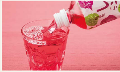
すっきりさわやかしそごち [(有)さめうらフーズ]

高知県を代表する果物の一つで、上品な酸味の中のかすかなほろ苦さが特徴の文旦と国産レモンを使用した混合果汁入り飲料です。土佐文旦の独特の苦みと酸味、レモンの爽やかな酸味がミックスされた今までにない仕上がりに!果汁と甜菜糖のみの純国産のドリンクをお楽しみください。