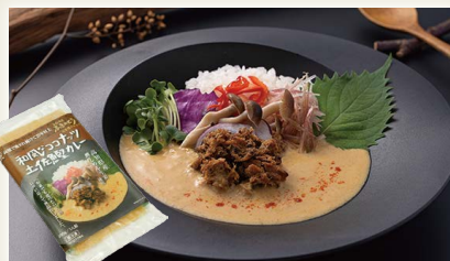
和風なココナツ土佐鯉カレー [ふきのとう]