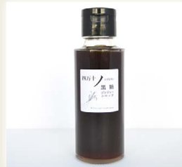
四万十ノ黒糖ジンジャーシロップ [四万十ノ(株)]