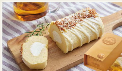
雪ヶ峰ロールプレミアムジャージー