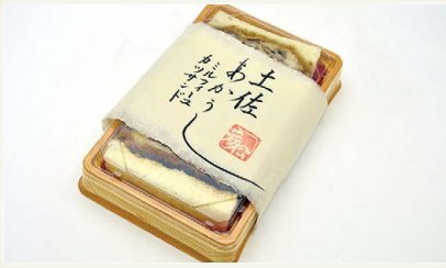
土佐あかうしミルフィーユ カツサンド [とんかつ芳松]