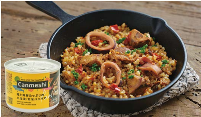
鯉と海鮮たっぷりの 土佐流・玄米パエリア [(株)黒潮町缶詰製作所]