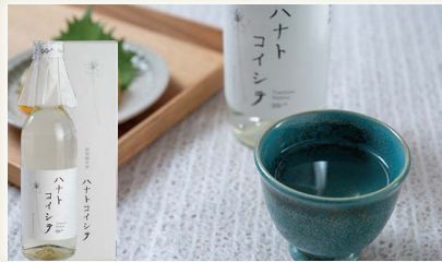
司牡丹ハナトコイシテ [司牡丹酒造(株)]