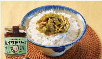
僕、イトドリっす [(株)いしはらキッチン]