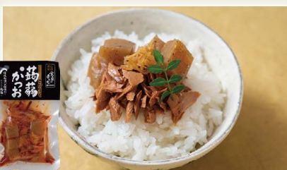
食卓のおとも 蒟蒻かつお [(有)森澤食品]