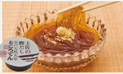
土佐の鰹だし 室戸天然天草ところてん [横山麺業(株)]

土佐あかうしのバラ肉を何層にも重ねたカツサンド。素材の良さをふんだんに引き出した自信作。お値段以上の満足感を保証します。