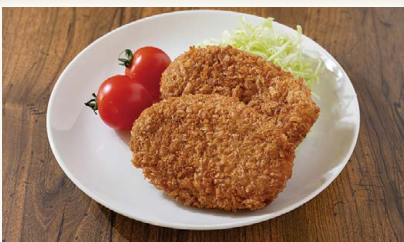
室戸海洋深層水仕込み筍の土佐煮と 高知県産青のりたっぷりコロッケ