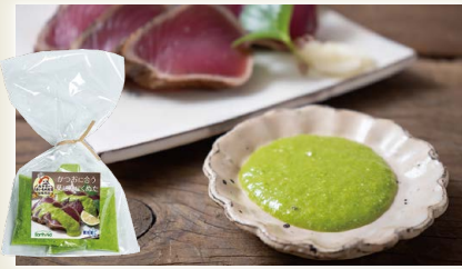
かつおに合う葉にんにくぬた [(株)アースエイド]