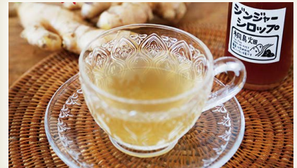
桐島畑のジンジャーシロップ [桐島畑]