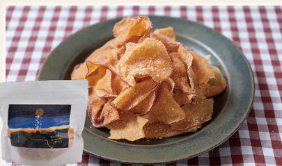
空飛ぶさつまいも