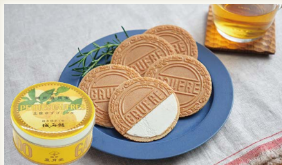
土佐ゆずゴーフル [(株)城西館]