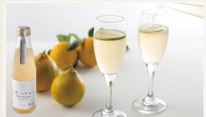
土佐ベルガモットスパークリング [(有)スタジオオカムラ]