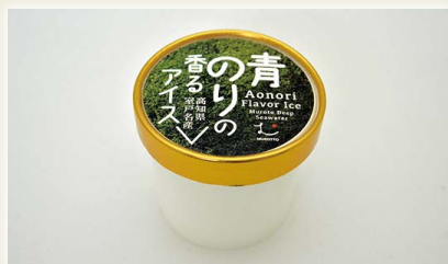
青のりの香るアイス [(有)安芸グループふぁーむ]