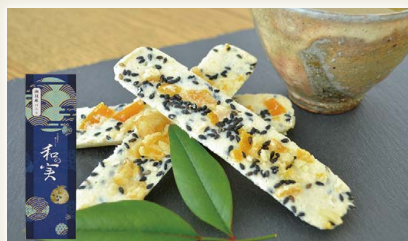
土佐柚子の焼ショコラ

土佐紅金時をてんさい糖で包んだ甘さ控えめの芋菓子。軽やかな食感に懐かしさと新しさを織り込みました。