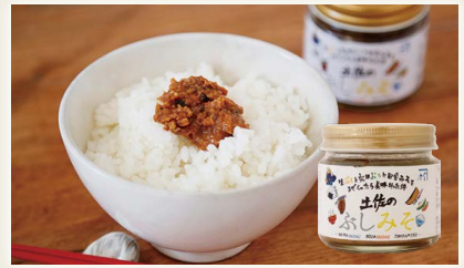
土佐のぶしみそ [(株)竹内商店]