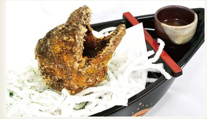
海のギャング揚げ

四万十川に遡上してくるシラスウナギを四万十川源流域の町・四万十町で水質・水温・餌に至るまで徹底的にこだわって育てた自慢の鰻を、およそ50年受け継いだ秘伝のタレを丹念に4回つけ焼き。創業以来守り続けた、ふっくらと香ばしい味です。