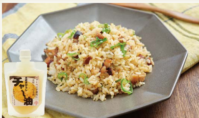
土佐あかうしチャ〜油 [嶺北麻飯店]