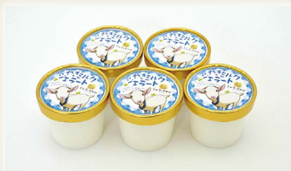
やぎミルクジェラート [ドルチェかがみ合同会社]