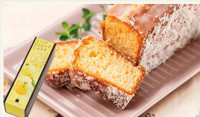
スリムパウンドケーキ 柚子