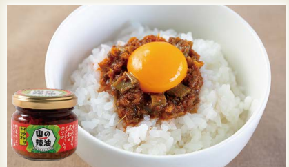
山の辣油イタドリカツオ [(株)いしはらキッチン]