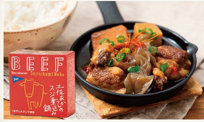
土佐あかうしのスジ煮込み鍋 [(株)黒潮町缶詰製作所]