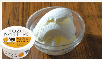
ゆずミルクアイス [(有)高知アイス]