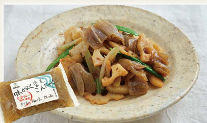
味がよく染むこんにゃく [岡林食品(有)]