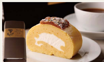
西山金時スウィートポテトロール

高知県産品である柚子と天日塩を使用し、胡麻とバニラのフレーバーを加え焼き上げた和のショコラです。爽やかな風味と優しくまろやかな甘みが口に広がる土佐の茶菓子をご賞味ください。