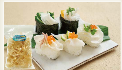
高知県仁淀川町産