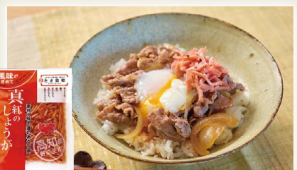
真紅のしょうが [東洋園芸食品(株)]