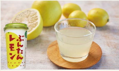
ぶたんレモン [(有)高知アイス]