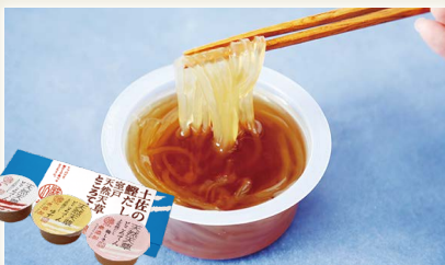
土佐の鰹だし室戸天草 ところてん無添加ギフトセット [横山麺業(株)]