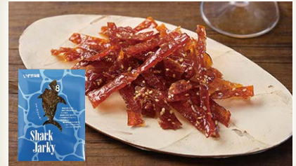
シャークジャーキー [(有)いずま海産]