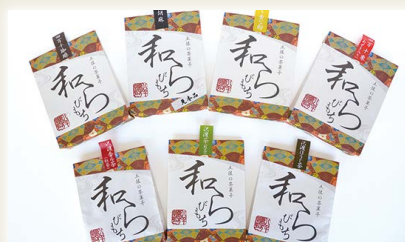
土佐の茶菓子 和らびもち