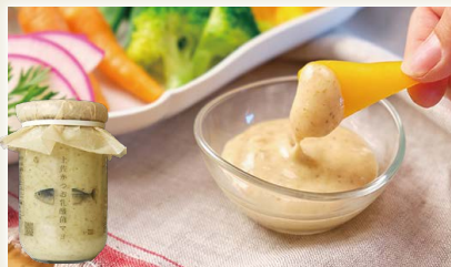
土佐かつお乳酸菌マヨ [ミタニHD(株)]