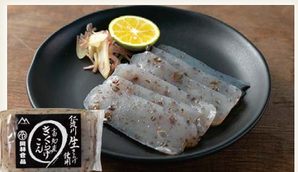
高知産きくらげこん [岡林食品(有)]